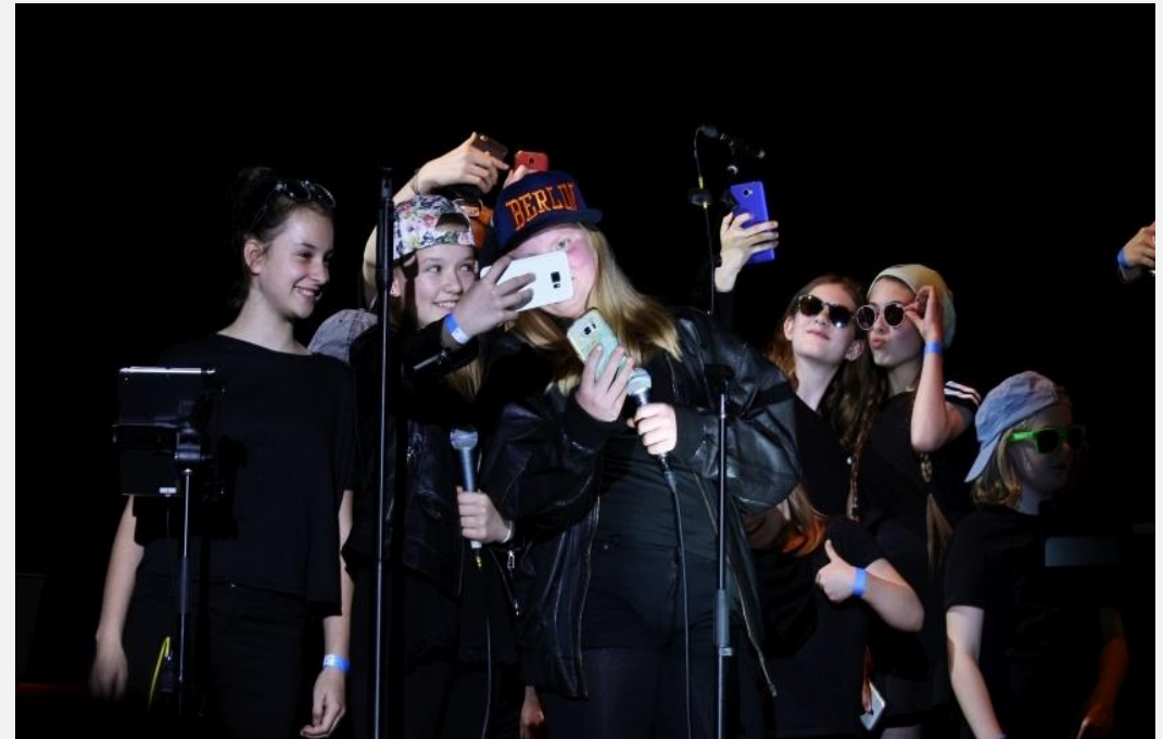
Die FvS-Young Voices