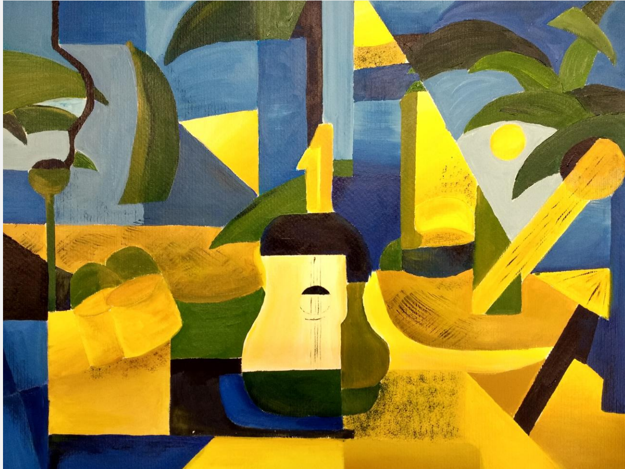
Simon Lieneke, Q2