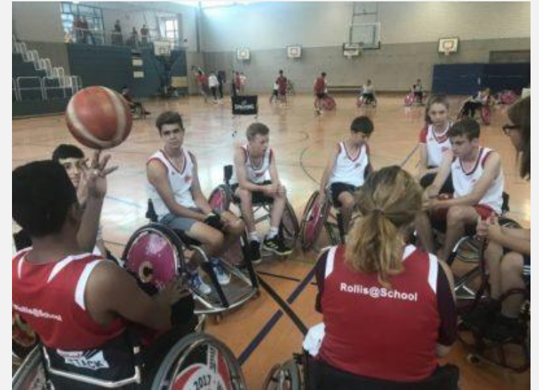
Die inklusive Basketball-AG